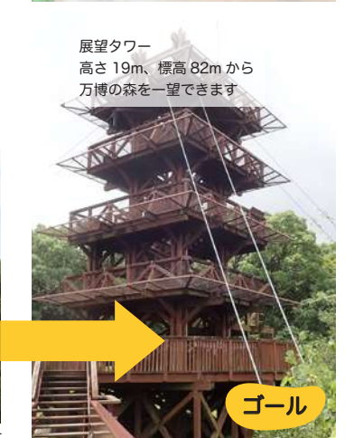
のぼり口(木登りタワー)階段を上るにつれて、視点がひらけていきます