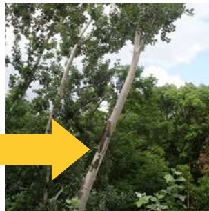
白い幹や葉が一際目立つギンドロの木