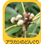
アラカシのどんぐり