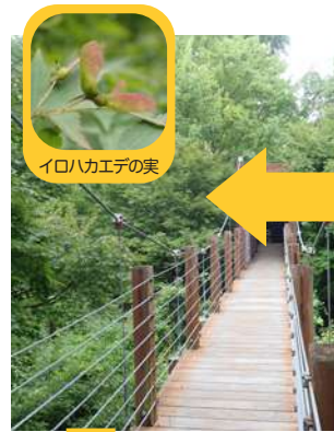
イロハカエデの実