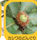
カシワのどんぐり