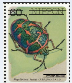
アカスジキンカメムシ