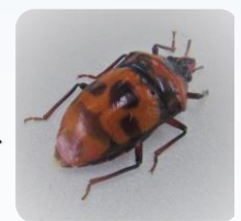
昨年、公園でみつかったとても珍しいオオキンカメムシ⇒