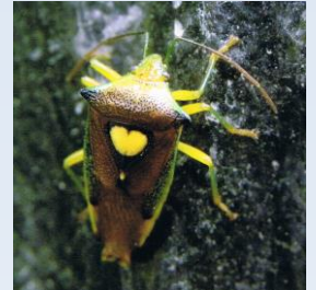
昆虫シリーズ第一集 (1986・7・30発行)