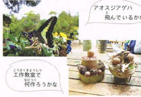
アオスジアゲハと飛んでいるかな